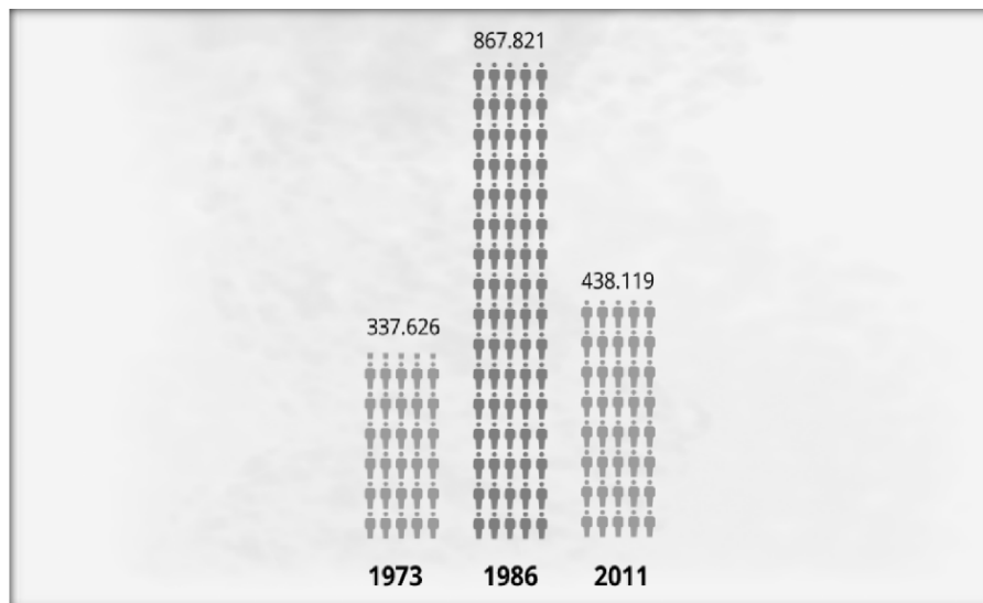
Figura 2. Impacto de la violencia en el área general de los Montes de María

A lo largo de la historia esta área ha sido de gran atractivo por los diferentes actores legales e ilegales, esto como consecuencia al gran potencial en la industria agropecuaria y ganadera.