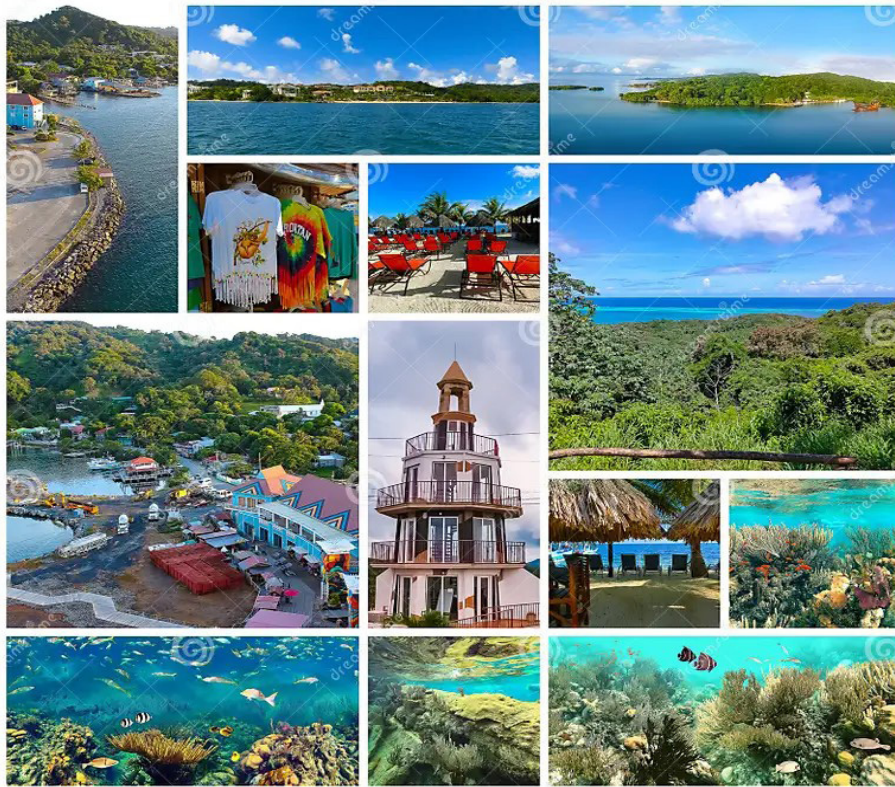
Anexo 2. Roatan – Honduras