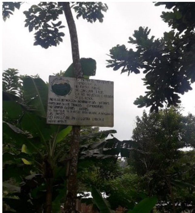
Imagen 7. Pancarta con logo y principios de la Comunidad de Paz.