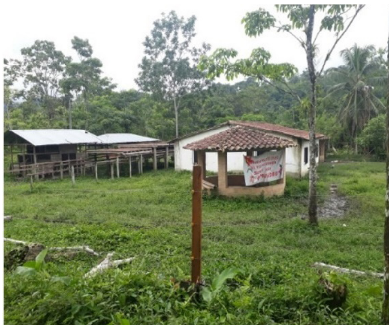
Imagen 4. Comunidad de paz

Entre los pobladores de San José de Apartadó predominan los campesinos paisas provenientes de la zona Andina (Dabeiba, Uramita, Cañasgordas y sur oeste Antioqueño), que se han adaptado a estas condiciones biofísicas e interactúan con campesinos cordobeses de la parte alta del Sinú. La actividad productiva es poca, dada la baja densidad de población y las difíciles condiciones de accesibilidad. Es así que, se resalta la economía campesina de autoconsumo con bajos excedentes de comercialización en donde el principal producto es el cacao yuca y el maíz, vendido en el municipio de Apartadó. La comunicación de las veredas pertenecientes a esta Unidad se realiza con la cabecera del corregimiento San José de Apartadó a través de diferentes caminos veredales (Libro de Diagnóstico Integrado, 2005).