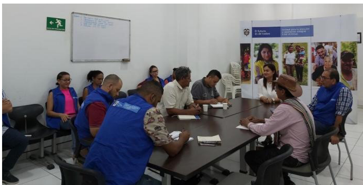
Imagen 8. Víctimas de San José de Apartadó identifican rutas y procesos de reparación

El Acuerdo de Paz celebrado entre el Estado Colombiano y la Guerrilla de las FARC no ha servido de algo, pues las violaciones continúan y las Instituciones Oficiales que representan al Gobierno Nacional y Local, siguen siendo omisivas. Hay paramilitarismo en la zona que controla muchas vías de acceso y espacios de la región. El ejército logró mediante una tutela que un juez le ordenara a la comunidad se retractara de las afirmaciones de que la FFAA seguían protegiendo y actuando en contubernio con los paramilitares.