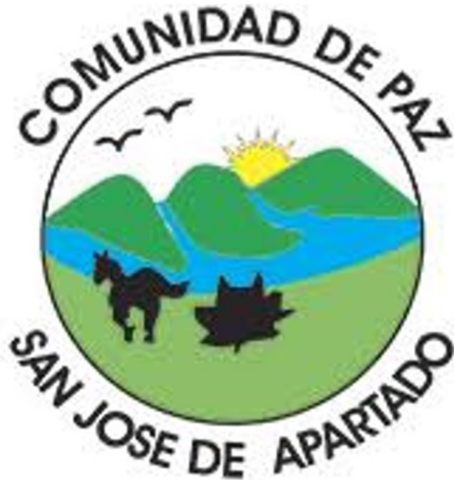
Imagen 6. Logo Comunidad de Paz