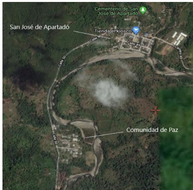
Imagen 3. Comunidad de paz