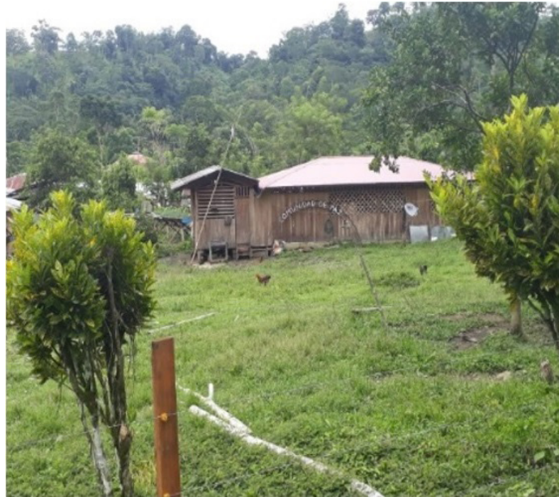
Imagen 5. Comunidad de paz