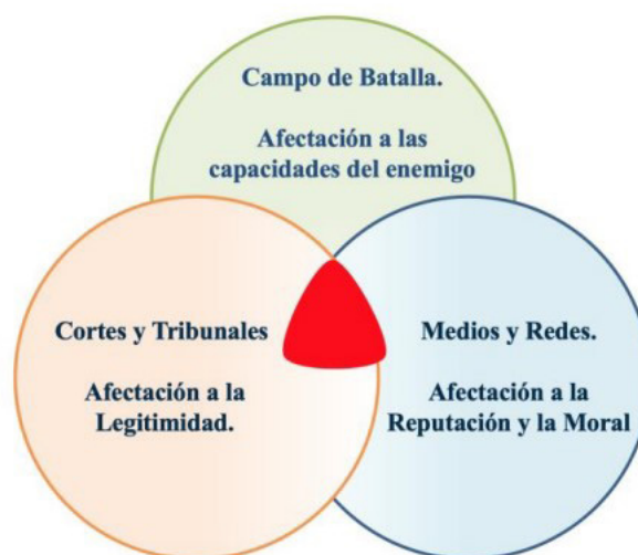
Figura 3. Escenarios donde se combate el CANI.

Es esencial comprender que las FF.MM. no operan exclusivamente en el campo de combate, sino que cada decisión que se tome debe considerar múltiples aproximaciones y debe estar contemplada en un marco jurídico que permita desarrollar las operaciones aplicando los principios del DICA para la conducción de las hostilidades y uso de la fuerza con seguridad jurídica y no influenciado por externalidades como los medios de comunicación y las redes sociales. Así como Collin Powell manifestó que “las guerras del siglo veintiuno serán guerras de abogados”; Mejía (2019) plantea que “las guerras de la posmodernidad no se definirán en el campo de batalla sino en las redes sociales y en las primeras páginas de los medios de comunicación”. El escenario donde se debe combatir y ganar este CANI comprende la intersección que se genera entre el campo de batalla con la complejidad actual, los tribunales y los medios de comunicación respectivamente como se ilustra en la figura 3.